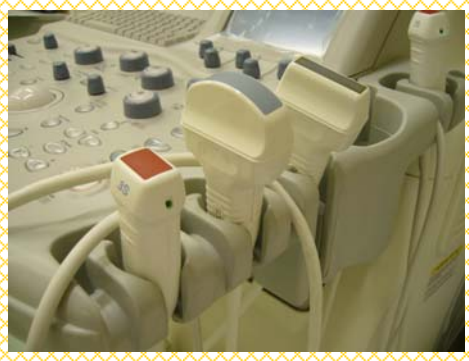
ゼリーを介して身体に触れる装置 (70-7)