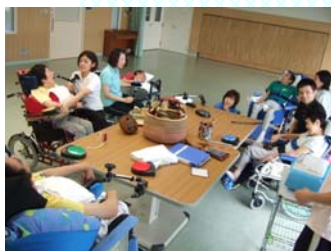
グループ祭り(わっしょい)の様子

月に一度、第二火曜日の午後10時に音楽・ダンス好きが集まって活動しています。テーマ曲をみんなで決めて、曲に合わせて楽器演奏をしたり、車椅子ダンスをしています。今年度のテーマはグループ名にある通り、「祭り(わっしょい)」です。月に一度なので毎回近況報告を含めた挨拶から始まって、「アルゴリズム体操」で準備運動、からだを温まってきたところでスイッチをつかったり、直接触れたりして楽器演奏を楽しんでいます。祭りの雰囲気のできにきてみてくださいね。