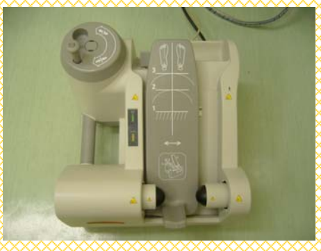
超音波を利用した骨塩定量装置 (骨密度を測ります)