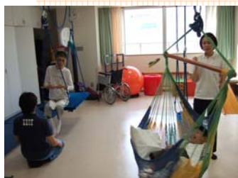
遊具グループの様子

月に二度、第一、三月曜日の午後10時にOT室1に集まってオンラインスイングやハンモック、トランポリンやボールプールなどの遊具で遊ぶグループです。音楽にのって、あるいは歌や太鼓に合わせて揺れや振動を楽しんでいます。普段はなかなかじっくり揺れ遊具に関わるのが難しい方も、OTと一対一で遊具に関わることができるアクティブだけどゆったりなグループです。遊園地気分の遊具グループ、通りがかったらのでいてみてくださいね。