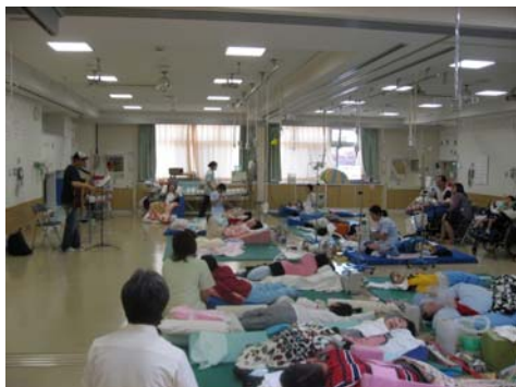
歓迎会でのミニコンサート ギターの弾き語りの様子