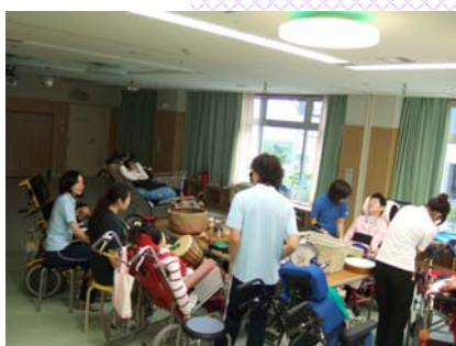
青春音楽団の様子

青春音楽団は、みんなの好きな曲を楽器で演奏して楽しむグループです。各病棟から選りすぐりのメンバーで、総勢八名の楽団です。月一回、第四火曜日の十四時三〇分です。毎回、「手のひらを太陽に」の歌に合わせて、手足の他動運動や車椅子ごと優雅にダンス(体操?)をして、心と身体の準備をしてから、演奏をしています。演奏は、毎回好きな楽器を自由にセレクト！太鼓を叩いたり、シンバルを叩いたり、マラカスを鳴らしたり…。自分で楽器を叩いたり振ったり出来なくても、バイブレーターや電動肩たたきなどをスイッチで動かして元気に音を出しています。担当の職員は、演奏に合わせて合奏します。現在までに練習した曲は・・・「カエルの歌」「ドレミの歌」「小さな世界」「ミッキーマウス・マーチ」です。上手にやろうなんて思わず、とにかく「いっしょっぴい」音を鳴らして眠気も吹き飛ばす活動をめざしています〜。うるさいのがお好きなら…聴きにきてね！