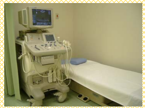
超音波検査装置と検査台

超音波検査は身体表面からのアプローチです。ので特別な器具をいりませんし、エックス線と違い被ばくの心配がありません。しかし、被検者の多大な協力が不可欠です。当院に入所、あるいは外来の患者様は身体的に強度の側わん症を抱えている方が多勢です。また、対面的な意思疎通にも難しい場合があります。十分な超音波検査を実施するにはとても大変で、困難を要します。このような状況下で少しでも異変を見つけるように検査員は努力しています。