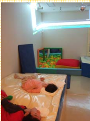
スヌーズレングループの様子

月に一度、第四金曜日の昼下がりにスヌーズレン室に集まってゆったりとした時間を過ごすグループです。季節ごとにテーマを変えて春の花、梅雨の雨、夏の花火、秋の紅葉などを光・映像・音・心地よい振動で表現した空間でそれらを楽しんでいます。通常の照明が明るすぎて目をつぶってしまうような方でも、うす暗い空間でやわらかな光を、目をほつちりと開いて熱心に見ている様子が見られることもあります。一緒に季節感を楽しんでみませんか？