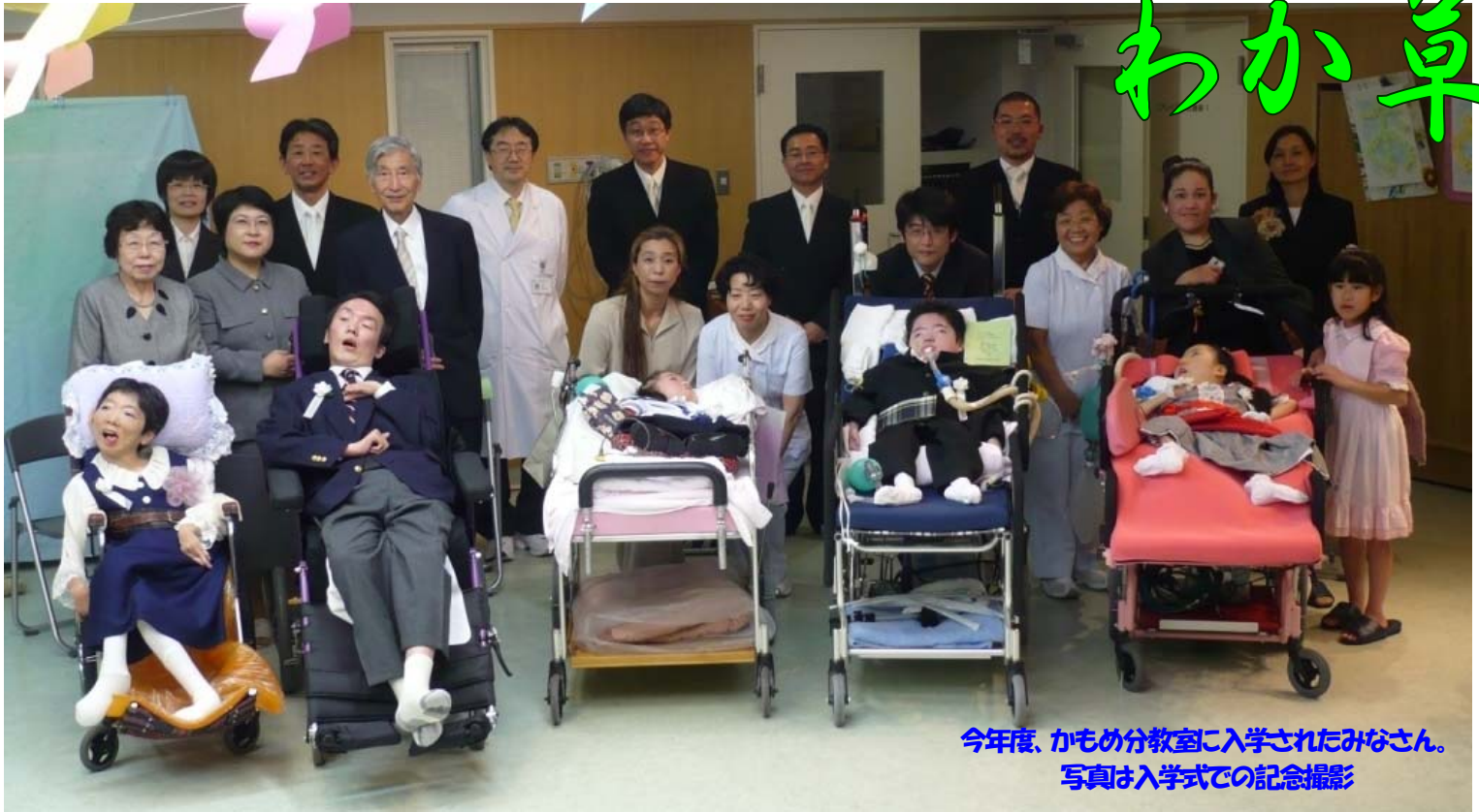
今年度、かもめ分教室に入学されたみなさん。 写真は入学式での記念撮影